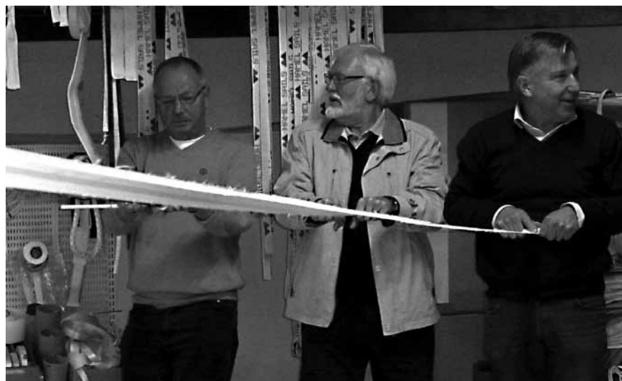
SXK-are provar tøjning hos olika segeldukar